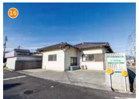
放課後等デイサービス事業所 Liebe