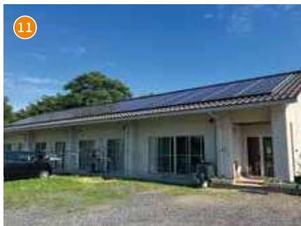
共同生活援助事業所 姫山の里