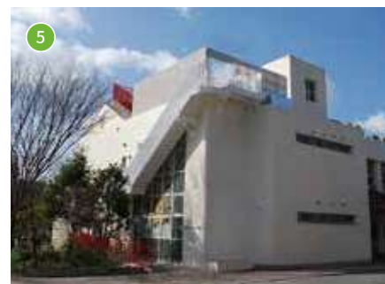
灘在宅福祉センター 定員：40名