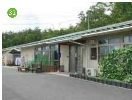
グループホーム清和