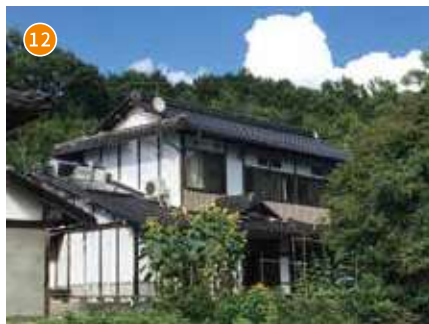
共同生活援助事業所 瓜生原