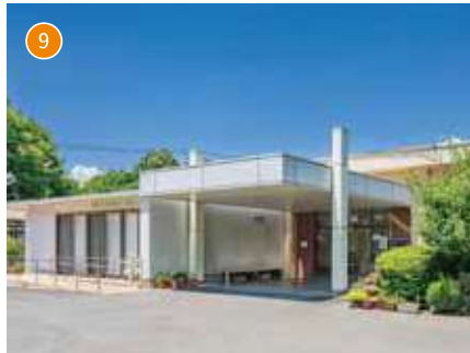
障がい者支援施設 みすず荘