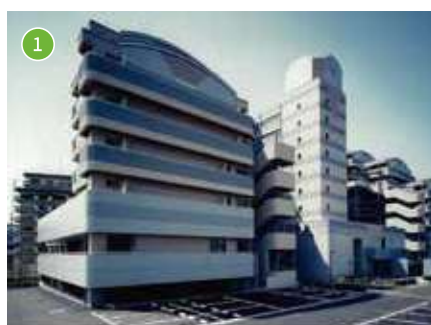
特別養護老人ホーム ロングステージ灘 定員：50名

大石高齢者介護支援センター 短期入所定員：30名／日中一時支援定員：40名 地域包括支援センター／居宅介護支援事業所 ☎078-821-3888