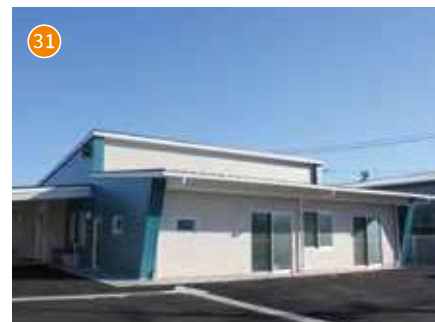
そうじゃ晴々 アクティビティハウス空