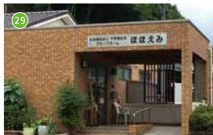
グループホームほほえみ