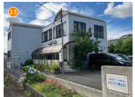
共同生活援助事業所 よりそい津山口