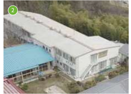
有料老人ホーム 白梅寮 ☎0868-26-0888