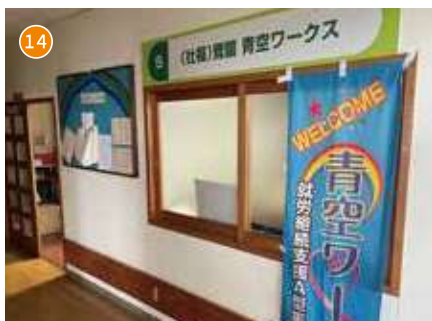
就労継続支援A型事業所 青空ワークス