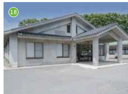
蒜山デイサービスセンター