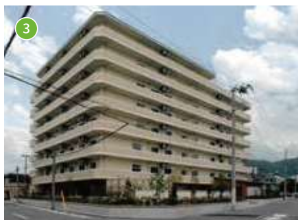
ケアハウス ロングステージKOBEOishi 定員：90名

特別養護老人ホーム ロングステージKOBEOishi 定員：29名／短期入所定員：11名