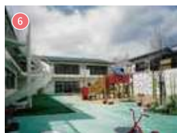
認定こども園 魚崎COCORO ☎078-858-5561