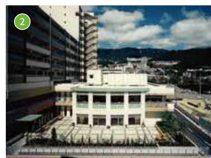
特別養護老人ホーム ロングステージKOBEOkamoto 定員：50名／短期入所定員：20名