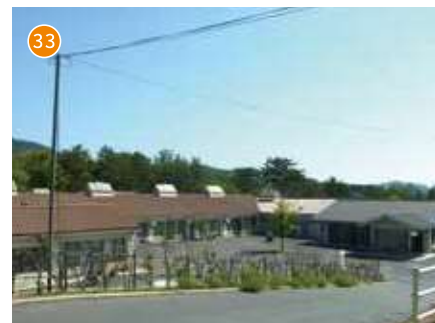
障がい者支援施設 吉備高原清和荘