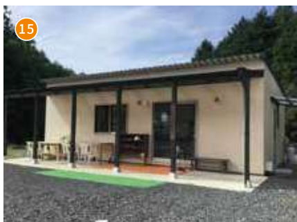
就労継続支援B型事業所 ホワイト