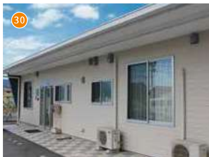
そうじゃ晴々 グループホーム星・月