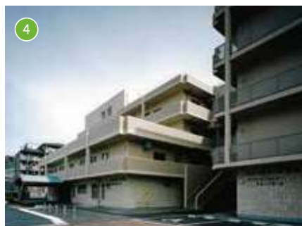
特別養護老人ホーム ロングステージ御影 定員：70名／短期入所定員：10名