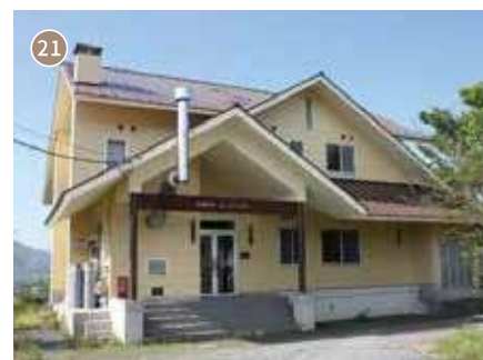
地域交流ホーム ロマンの館 ☎0867-66-3800